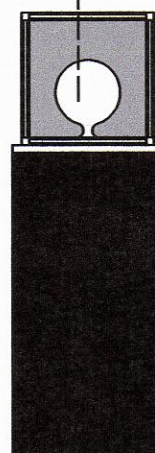
ΚΑΤΑΚΟΡΥΦΗ ΤΟΜΗ κλίμακα 1:20