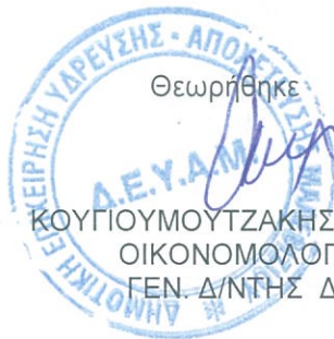
ΚΟΥΓΙΟΥΜΟΥΤΖΑΚΗΣ ΓΕΩΡΓΙΟΣ ΟΙΚΟΝΟΜΟΛΟΓΟΣ ΠΕ ΓΕΝ. Δ/ΝΤΗΣ ΔΕΥΑΜ